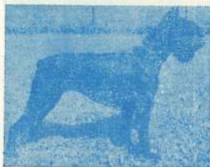
VS BONI OD CRNIH VRAGOVA