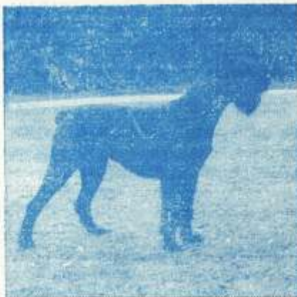
VS JOLA, vlasnica Olga Bizjan iz Polkov Gradeca

Kod pasje kuge imamo još neke druge kliničke pojave, na primjer, iscjedak iz nosa i očiju, kašljanje i grčevje. Isto tako i proljev je kod kuge i drugih virusnih infekcija znatno manje silovit i manje krvav nego što je kod parvoviroze.